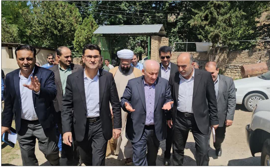
استاندار در دیدار اهالی روستای بادابسر:

حضور میدانی و مؤثر در روستاها و شهرستان ها در صدر برنامه هاست