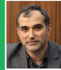
مدیرکل بندر امیرآباد مطرح کرد

مقاوم سازی ۴۴ هزار خانه روستایی با مشارکت روستاییان