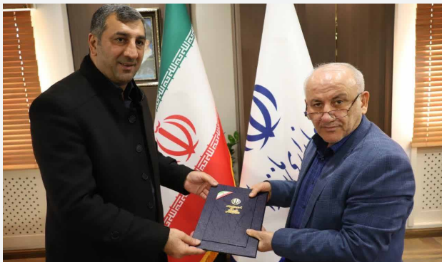
مسکن ایران خودرو را در کارنامه خود دارد.

امید است با اتکال به خداوند متعال و بهره‌گیری از تجارب علمی و عملی خویش و استفاده از پتانسیل‌های بالفعل و بالقوه نهفته در حوزه مسئولیت جدید در ایفای وظایف محوله موید و منصور باشید.